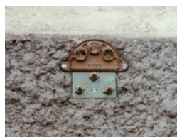
Platte 3 Löcher Ø 20 Düse lang Ø 4