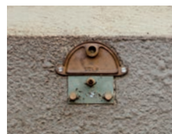
Platte 1 Loch Ø 14 Düse kurz Ø 4