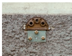
Platte 3 Löcher Ø 14 Düse Ø 2,7