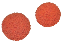
Schwammgummikugel 2 Schwammgummikugeln P 602