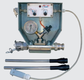
Kit speziell für die Injektion P 731