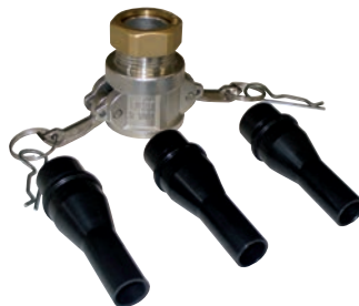
Kit zum Verfugen 1 Adapter + 3 Düsen zum Fugen Ø 10, Ø 12 und Ø 14