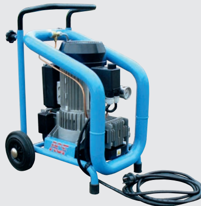
Druckluftkompressor 200 l/mn N 001