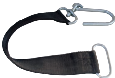
Schlauchtragegurt P 603