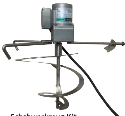
Schabwerkzeug Kit für pastöse Produkte P 373