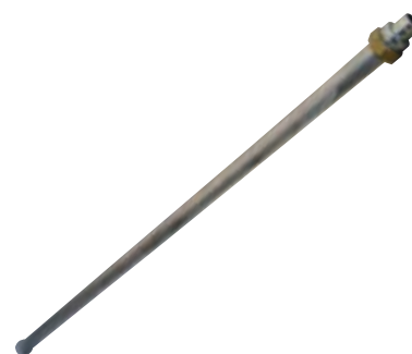
Rohr speziell für Bodenplatten P 739