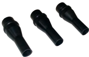
3 Düsen für die Verfugarbeit Ø 10, Ø 12 und Ø 14