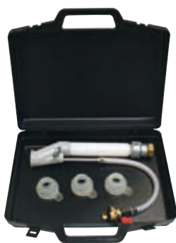
Kit für Aufspritzen • 1 Aufspritzlanze mit einer Ø 14 Düse (Luftbedarf: 300 l/mn) • 2 Düsen für Aufspritzarbeiten: Ø8 (P778) + Ø10 (P780) P 735