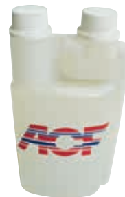
0.50 L hydraulischer ACF Expander Kanister P645