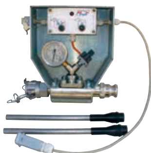
Kit "speziell für die Injektion" P 737