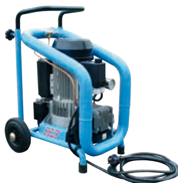
CM1 Luftkompressor Elektrischer einphasiger Kompressor für Anwendung im Aufspritzmodus. Wird geliefert mit einem Luftschlauch und Kupplung N 001